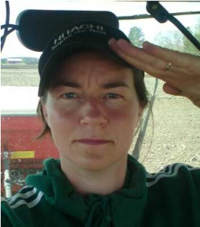
Bonde fra fjellet

Dæm e en rettete trivele gjeng. Tar alltid hensyn til våronna og fjøstid.